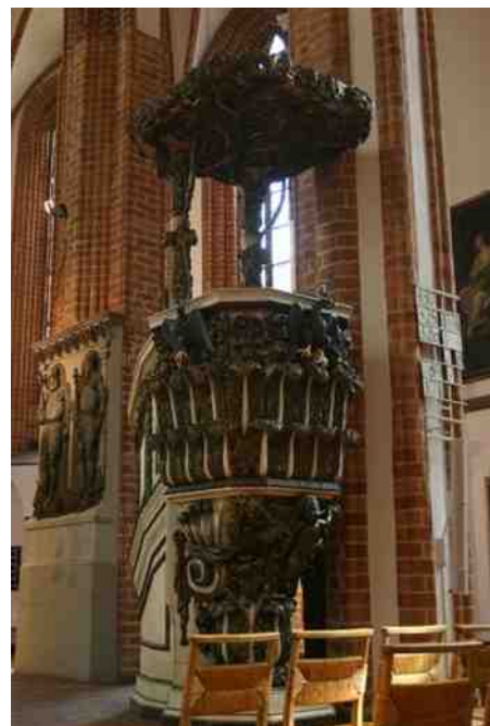
Kansel van de Nicolai Kirche in Berlin- Spandau