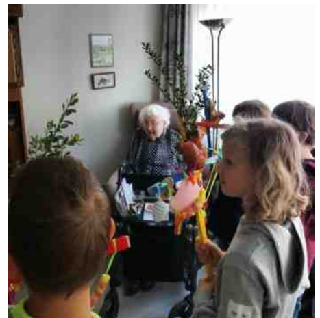
Op bezoek bij zr. Bassa in Maison Gaspard de Coligny