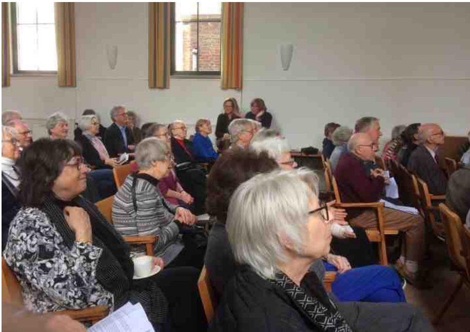
Gemeenteberaad op 24 maart over de profielen van de gemeente en de nieuwe predikant